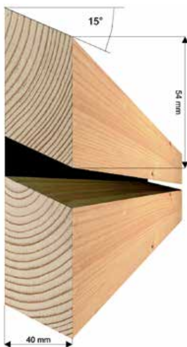
Cadre de façade (losange) Parallélogramme En option 10°, 15°, 20° ou 25° (Profil N°2)