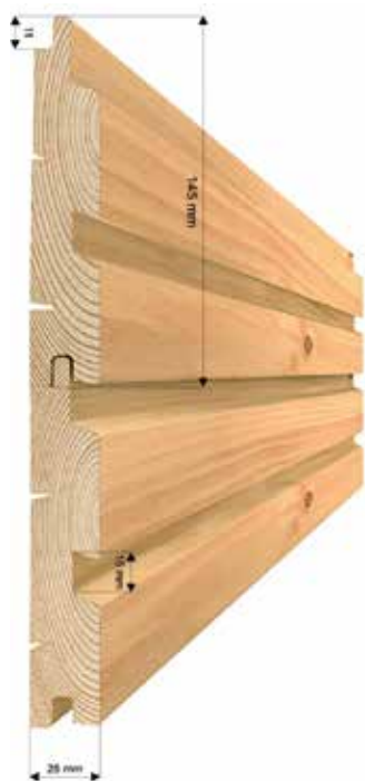
Profilé de façade (double losange) (Profil N°1)