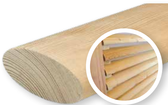
Profilé ellipse (profilé de façade type mur-rideau) 27 mm d'épaisseur et 68 mm de largeur Sortes de bois : épicéa et mélèze (Profil N°4)